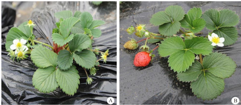
图 1 草莓五倍体(A)和十倍体(B)植株