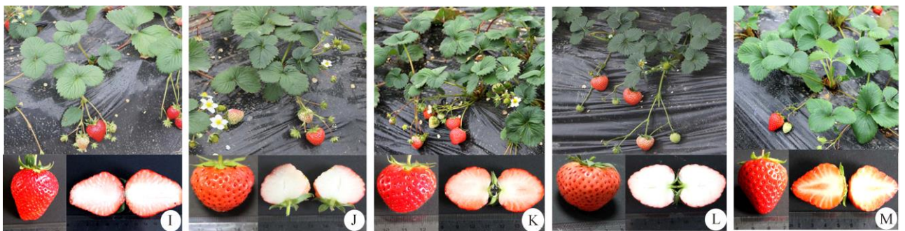
图 4 4 个具有蜜桃香味的草莓新株系和‘红颊’。I: 5 + -01; J: 5 + -02; K: 5 + -03; L: 5 + -04; M: ‘红颊’。