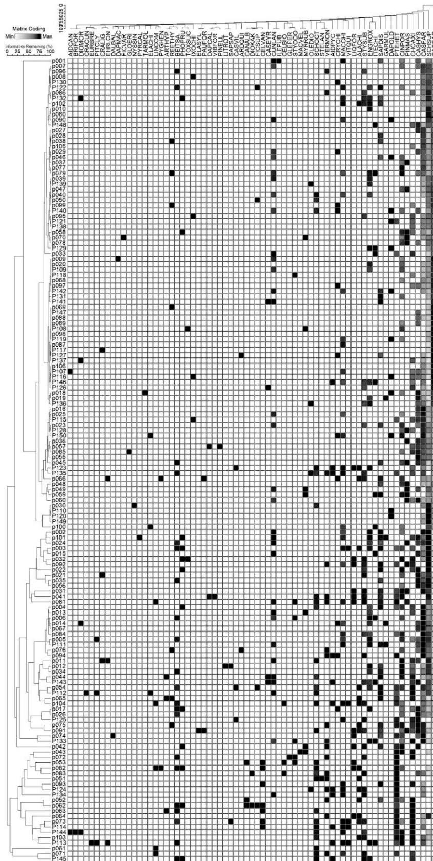
图 1 基于林分树种组成的样方双向聚类分析。横轴为种名，纵轴为样方号；灰度的深浅代表相对基盖度的大小。