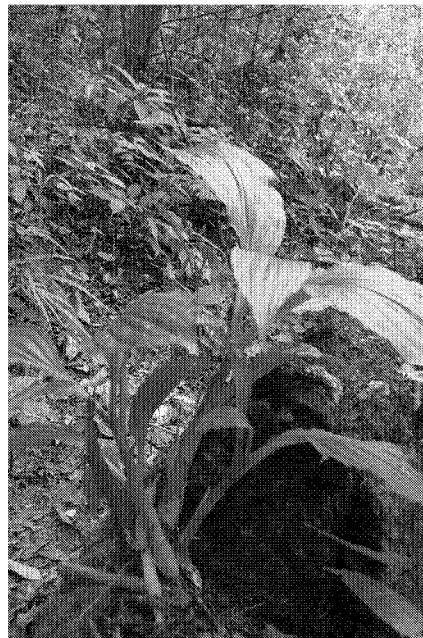
图 1 插天山羊耳蒜