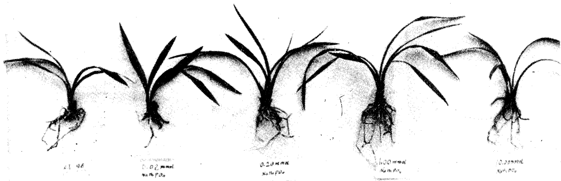
图1 不同磷水平对墨兰植株的影响

从植株外形(图1)来看。完全缺磷时植株矮小,1mmol/L处理的植株最壮,根系也发达。缺磷处理植株叶片的褐斑病病斑 [4] 最多,说明它的抗病力差。随着磷浓度的提高,病斑减少,抗病力提高(图2)。