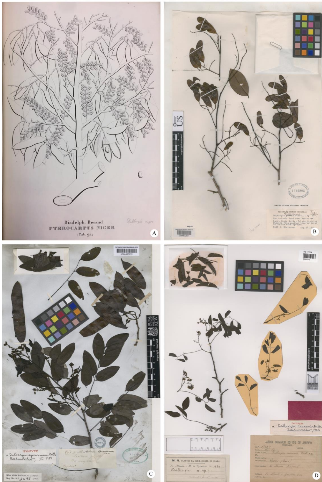
图 2 标本。A: 巴西黑黄檀的后选模式, Vell., Fl. Flumin. Icon. 7: t. 91. 1831; B: 伯利兹黄檀的主模式, Stevenson 10696 (holo-, US); C: 亚马孙黄檀的后选模式, R. Spruce 861 (K); D: 塞州黄檀的后选模式, Freire Allemão & Cysneiros 414 (RB)。