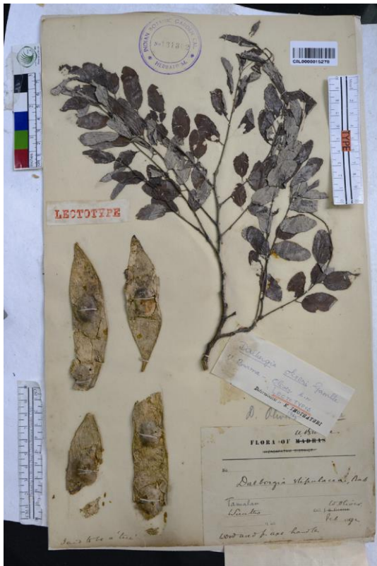
图 4 奥氏黄檀的后选模式, J. W. Oliver s.n. (CAL)

出, 细脉不明显; 小叶柄长 3~4.5 mm。圆锥花序顶生或近顶生, 10~15 cm×7~14 cm, 花量大; 总花序梗、花序分枝及花梗均被锈色微柔毛; 基生小苞片和副萼状小苞片小, 披针形, 极早落; 花长 8~10 mm; 花梗长 2~3 mm; 花萼钟状, 萼筒长约 2.5 mm, 被锈色微柔毛, 萼齿短, 5 枚, 最上 2 个圆, 其余尖, 最下 1 枚披针形, 长 0.55 cm, 较其余的萼齿长; 花冠淡紫色, 花瓣具长爪, 旗瓣圆形, 先端凹缺, 瓣片约 7 mm×7 mm, 反折, 爪长约 2 mm, 翼瓣阔倒卵形, 约 7 mm×3.5 mm, 爪长约 2 mm, 龙骨瓣半月形, 5 mm×2.5~3 mm, 爪长约 2 mm, 与翼瓣内侧同具向下耳; 雄蕊 10 枚, 为 5+5 的二体, 花丝上部 1/3 离生, 不等长; 子房镰刀形, 具柄, 下部及沿缝线被柔毛, 胚珠 3~4 枚, 花柱纤细, 锥状, 柱头稍膨大。荚果阔舌状、长圆形至带状, 6.5~14 cm×1.5~4 cm, 顶端急尖至渐尖, 基部渐狭, 果片革质, 无毛, 对种子处明显加厚突出, 无网纹, 其余部分常具网纹并延伸至边缘, 果柄纤细, 长 1.5~2 mm; 种子 1~2(~3)枚, 肾形, 扁平, 约 6 mm×12 mm。花期 3—4 月, 果期 6—11 月。