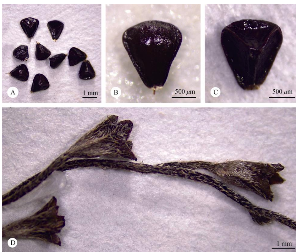
图 2 西南附地菜。A~C: 小坚果; B: 背面; C: 腹面; D: 部分花序, 示花萼。