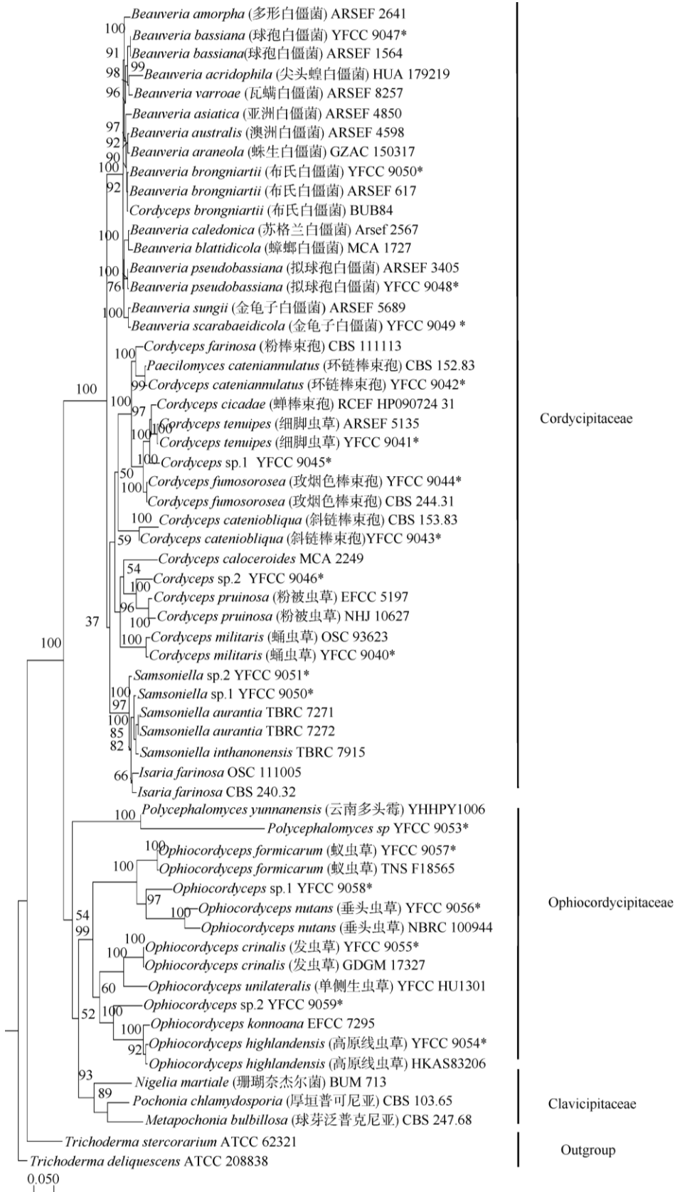
图 1 基于 5 个基因( nrSSU 、 nrLSU 、 EF-1 \alpha 、 RPB1 和 RPB2 )构建的巍山地区虫草系统发育树。*: 采自巍山地区。