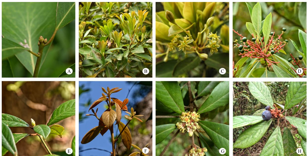
图 1 华润楠(A~D)和绒毛润楠(E~H)的物候期。A, E: 萌芽期; B, F: 展叶期; C, G: 花期; D, H: 果期。

从表 2 可见, 澳门路环水库绒毛润楠群落中种子植物属的分布区类型较丰富, 77 属可分为 12 个分布区类型(包括亚型), 以热带分布(包括热带和泛热带分布)为主, 有 67 属, 占总属数的 87.01%, 其中, 泛热带分布最多, 有 30 属, 占总属数的 38.96%; 其次是热带亚洲和热带亚洲-热带大洋洲分布, 分别有 12 和 10 属, 分别占总属数的 15.58%和 12.99%。植物属的温带性质较弱, 北温带分布仅有 2 属, 为松属( Pinus )和胡颓子属( Elaeagnus ), 占总属数的 2.60%。华润楠及优势树种绒毛润楠均为热带亚洲(印度-马来西亚)分布, 群落中较多的乌柏属