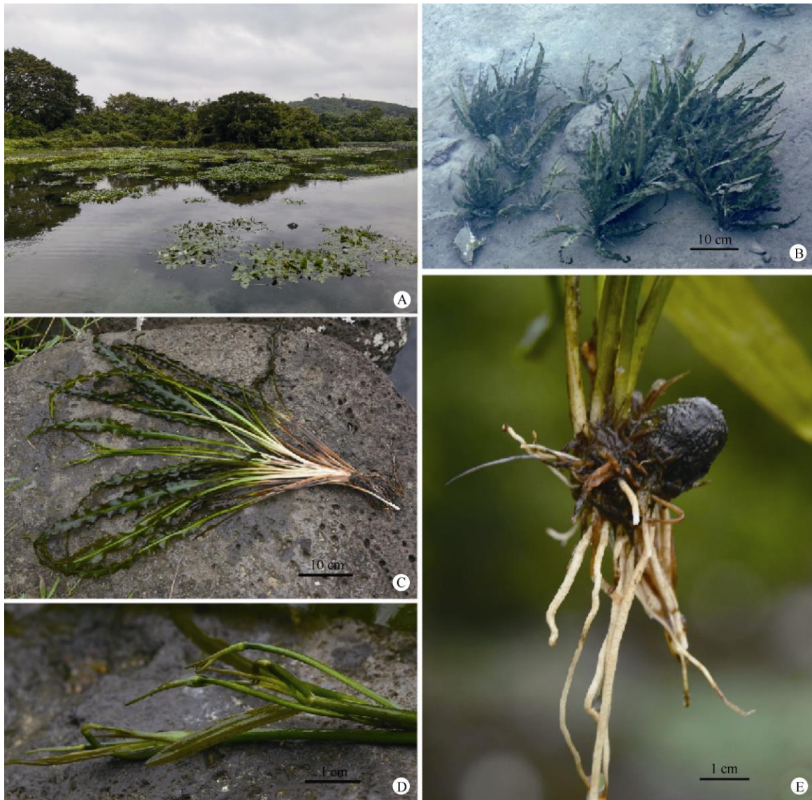
图2 波缘水蕹。A, B: 生境; C: 植株; D: 繁殖体; E: 块茎。