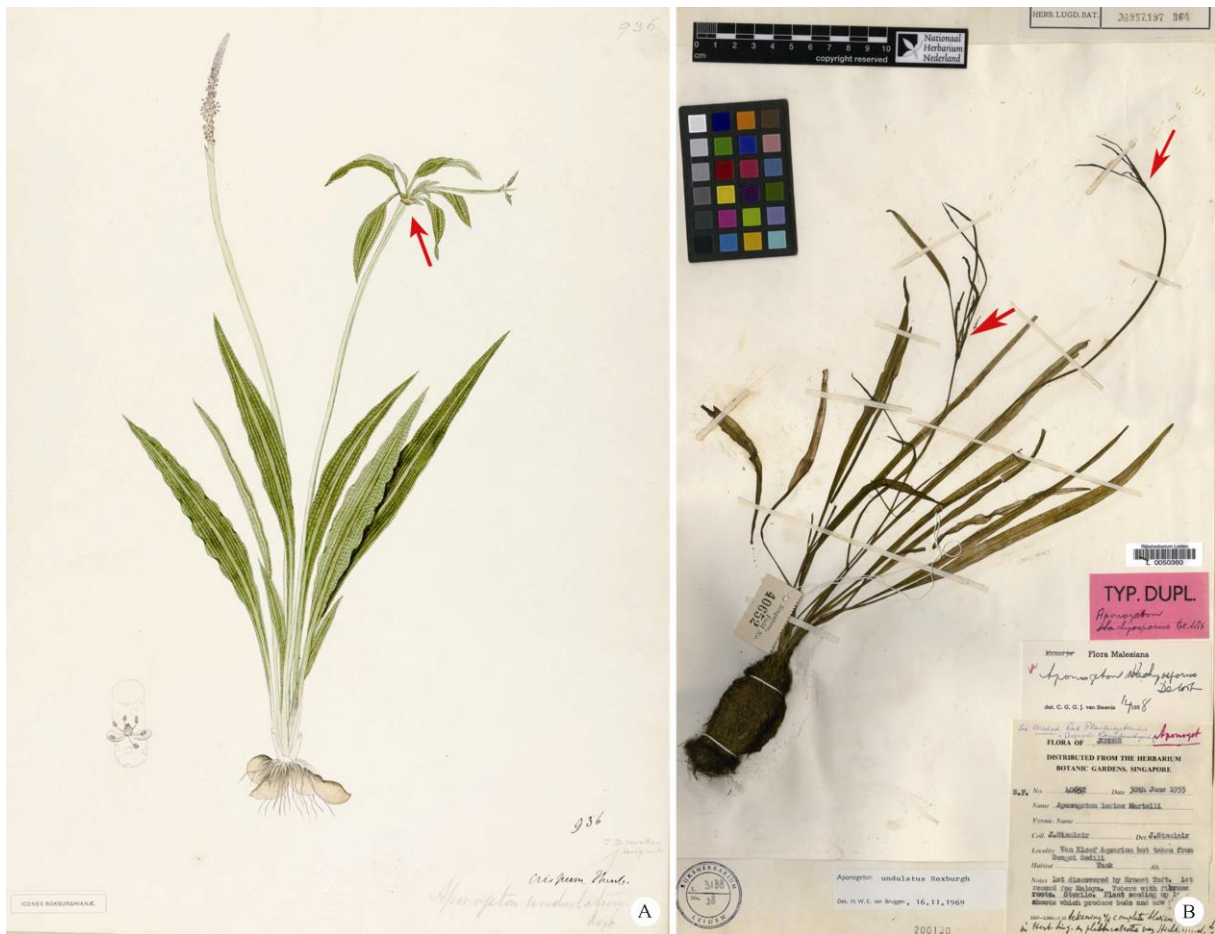
图3 波缘水蕹的模式标本(Roxburgh's drawing 936) (A)和 Aponogeton stachyosporus de Wit 的等模式标本(Sinclair SFN40652, L, barcode L0050360)(B)。箭头: 繁殖体。

Fig. 3 Type (A) of Aponogeton undulatus (Roxburgh's drawing 936) and isotype (B) of A. stachyosporus de Wit (Sinclair SFN40652, L, barcode L0050360). Arrows: Propagules.