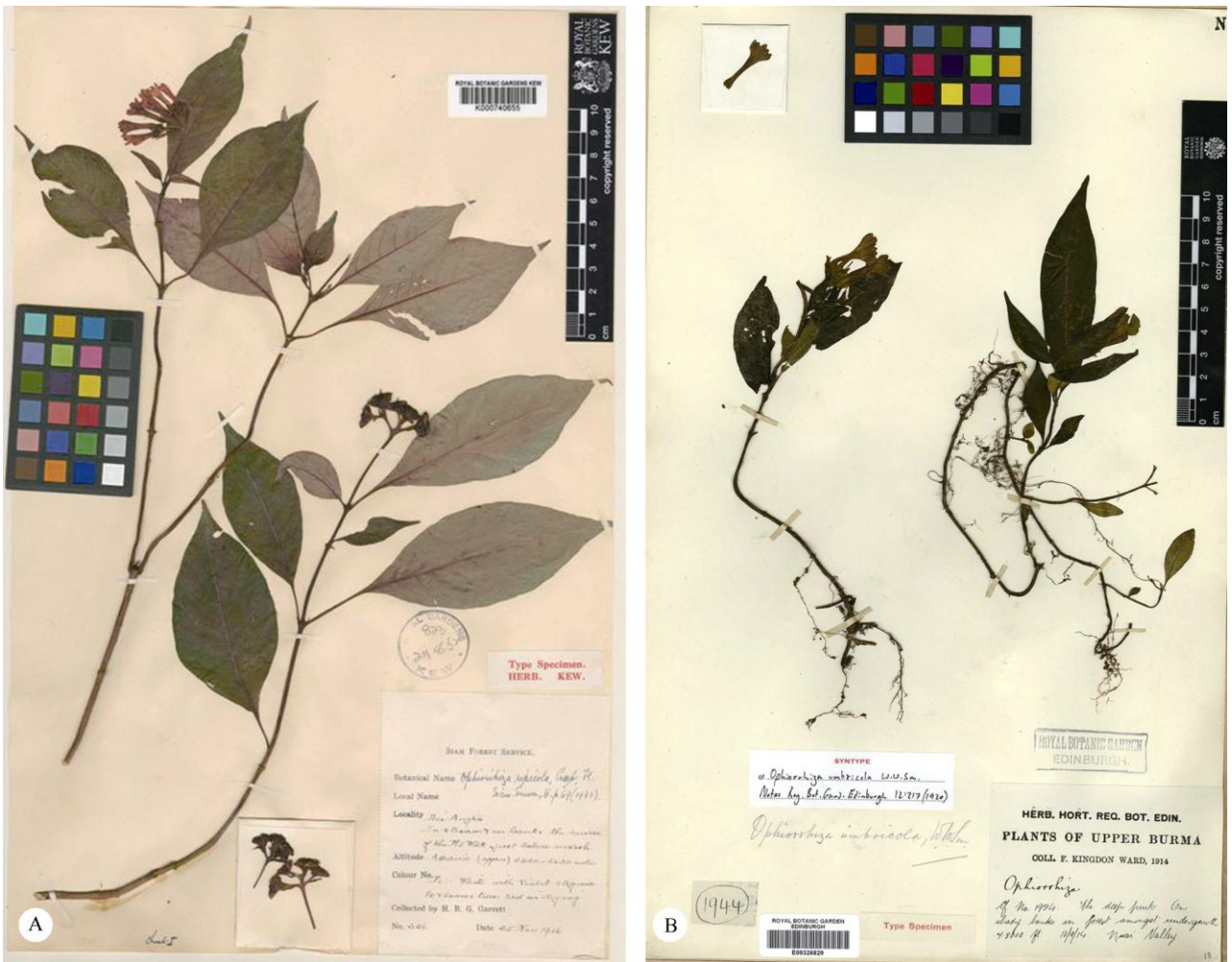
图2 模式标本。A: 中泰蛇根草; B: 阴地蛇根草。