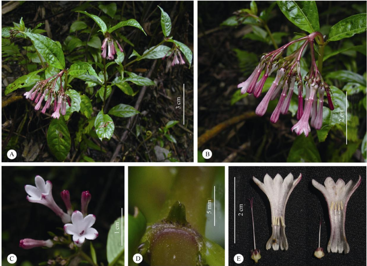
图 1 中泰蛇根草。A: 植株; B: 花序侧面; C: 花正面; D: 托叶; E: 长短柱花。

该种与阴地蛇根草( O. umbricola W. W. Sm; type: E 00326820) (图 2: B)在形态上相似,在标本馆中其部分标本被鉴定为后者。然而,该种与阴地蛇根草可区分,其中前者小苞片线形或窄披针形,花萼裂片长圆形至狭三角形,长 1.5~2 mm,花序总梗无毛,侧脉每边 5~8 条,花冠通常紫红色,冠管长 1~1.8 cm;而后者苞片卵形或椭圆形,花萼裂片三角形,长不及 1 mm,花序总梗被红褐色短柔毛,侧脉每边 10~14 条,花冠通常白色,冠管长 2.2~2.4 cm。