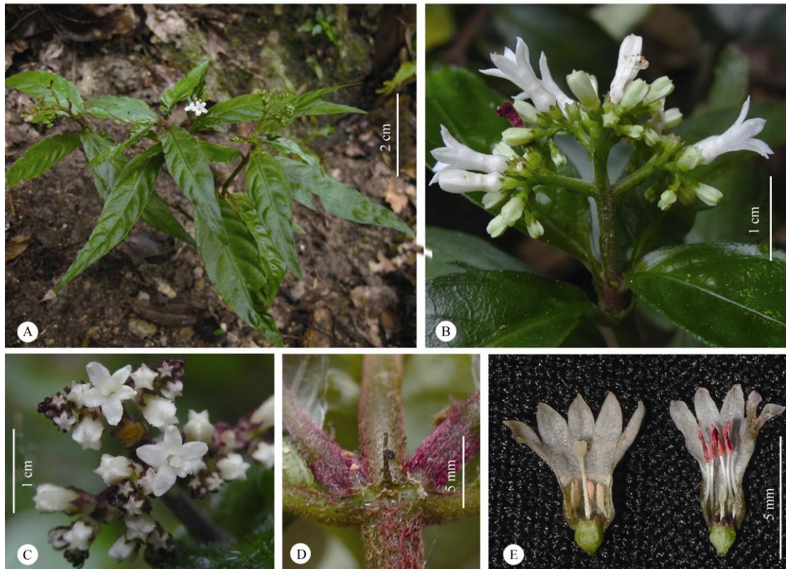
图 3 小果蛇根草。A: 植株; B: 花序侧面; C: 长柱花正面; D: 托叶; E: 长短柱花。