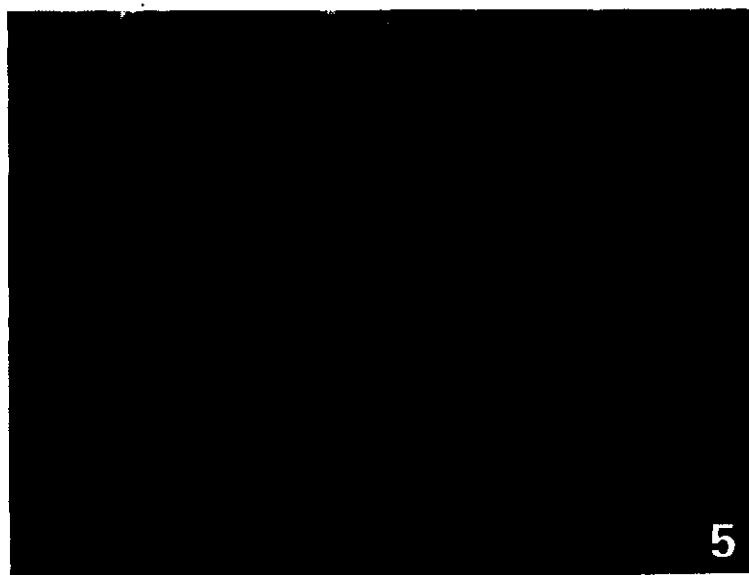
曾宋君等图版 I. 1. 垂序蝎尾蕉母株; 2. 垂序蝎尾蕉外植体出芽; 3. 继代增殖培养的垂序蝎尾蕉试管苗; 4. 生根培养的垂序蝎尾蕉试管苗; 5. 移栽成活的垂序蝎尾蕉试管苗。

ZENG Song-jun et al. Plate I. 1. Maternal plants of Heliconia rostrata ; 2. Budding explant; 3. Proliferated plantlets after subculture; 4. Rooting plantlets; 5. Transplanted plantlets on the field.