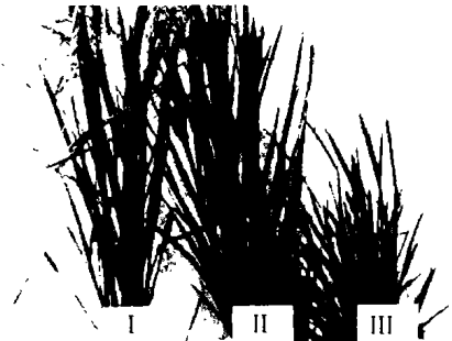
图2 IR66707A及IR69700A体细胞克隆中各种类型的变异 Fig. 2 Somaclonal variation types from male sterile lines IR66707A and IR69700A

I. 可育突变 Fertile mutant; II. 可被恢复的雄性不育突变 Male sterile mutants (restorable); III. 雌性不育变异 Female sterile variants