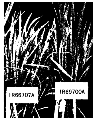
图 1 供体雄性不育系 IR66707A 及 IR69700A(对照) Fig. 1 Male sterile lines IR66707A and IR69700A(Control)

外植体 离体培养用幼穗和种子两种外植体,即上述两类不育材料的幼穗(发育时期为第二枝梗分化期 [9] ),以及 7A 和 0A 分别与其保持系回交所获得的当代种子。